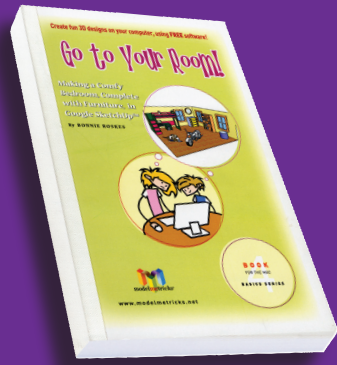
Libros y manuales